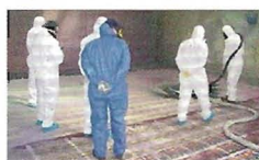
"Polyurea, the next generation"